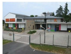
L'Orange Bleue à Riaillé