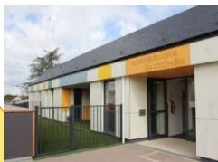
Maison de l'Enfance - Les Coccinelles à Joué sur Erdre